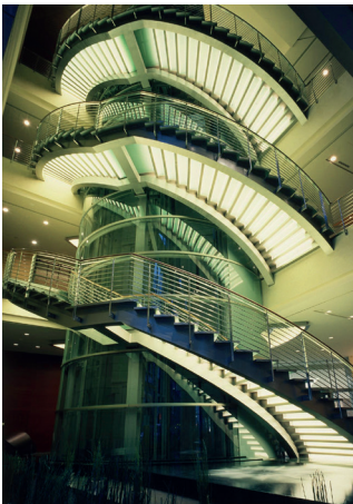
Khách sạn Grand Hyatt Tokyo tại Roppongi Hills

"Tính linh hoạt và năng lực chúng tôi thu về đều nhờ vào kiến thức và kinh nghiệm sâu rộng đạt được khi làm