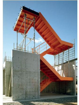
Cầu thang thép cho tòa nhà RC

"Ngoài ra, chúng tôi hiện cũng đang cố gắng tạo lập dấu ấn tại Đông Nam Á. Trong tương lai, khi giá nhân công tăng và nhu cầu về cầu thang sản xuất tại nhà máy, chúng tôi có thể sẵn sàng cung cấp cho nhu cầu đó và dẫn đầu trên thị trường."