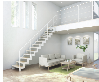
Cầu thang nhà ở "SYSTAIR"