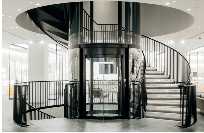
Trung tâm văn hóa Japan House London

Trong 70 năm qua, Yokomori đã góp phần đưa ngành xây dựng của Nhật Bản vươn lên một tầm cao mới.